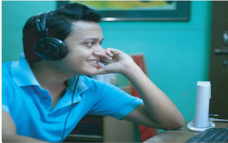
কম্পিউটার ব্যবহার করে গান শোনা যায়।