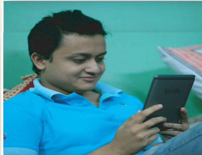
ই-বুক রিডার ব্যবহার করে বই পড়া যায়।