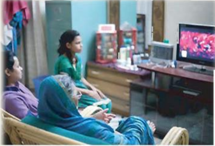
টেলিভিশন এখন বিনোদনের সবচেয়ে বড় মাধ্যম।