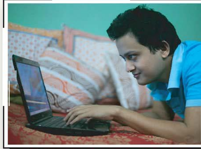
কম্পিউটার নেটওয়ার্ক ব্যবহার করে ঘরে বসে সারা পৃথিবীর সাথে যোগাযোগ করা যায়।