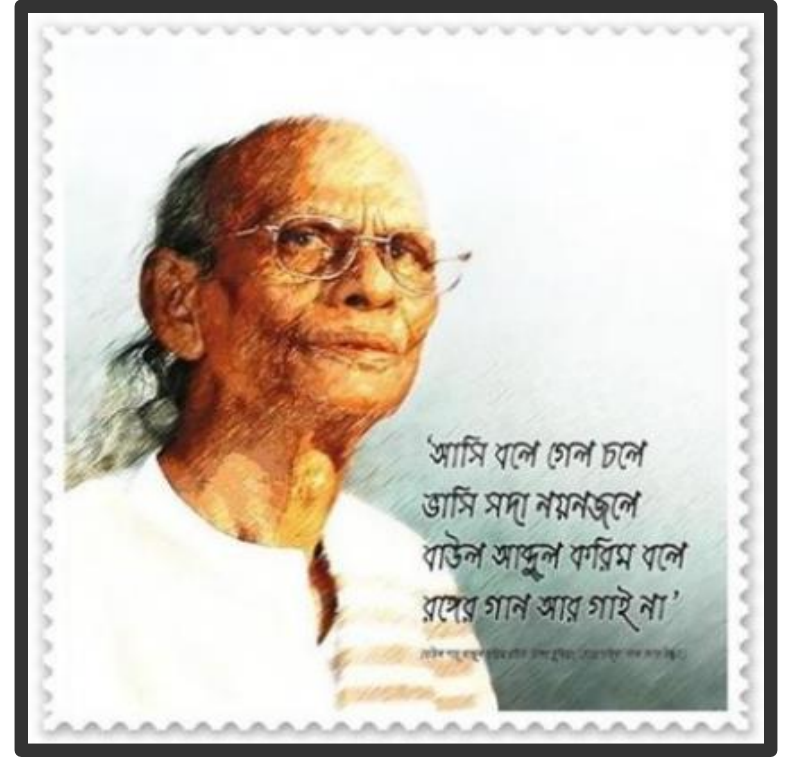
শাহ আব্দুল করিম